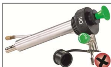
Pompes Optimus Nova et Nova+ non concernées par le rappel avec soupape d'alimentation verte et embout de piston vert.