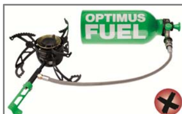
Réchaud multicomcombustible Optimus Nova avec brûleur de couleur noire et numéro QA, concerné par le rappel.

Les réchauds multicomcombustibles concernés possèdent un brûleur noir et un numéro QA compris entre QA000011 et QA007313. Les réchauds Nova et Nova+ possédant un brûleur couleur argent n'ont pas de référence affichée et ne sont pas concernés par le rappel. Les réchauds et les pompes faisant l'objet du rappel ont été vendus par des redistributeurs d'articles de sport et d'équipement de plein air et sur Internet entre janvier 2009 et septembre 2010.