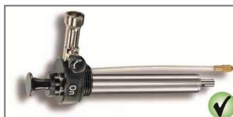
Pompes Optimus Nova et Nova+ non concernées par le rappel avec soupape d'alimentation noire et embout de piston noir.

Les pompes Optimus Nova et Nova+ concernées par le rappel possèdent une soupape d'alimentation en combustible verte et embout de piston vert.