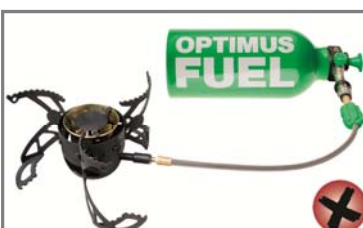
Réchaud multicomcombustible Optimus Nova+ avec brûleur de couleur noire et numéro QA, concerné par le rappel.